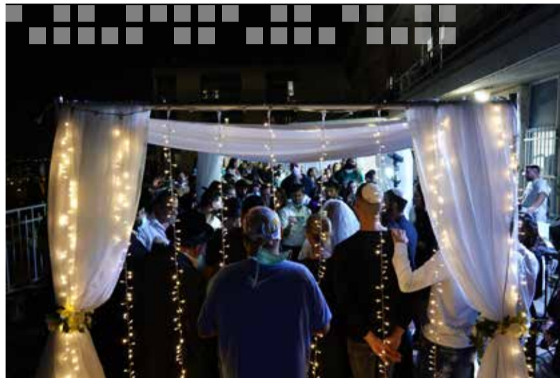
→ → → → → אירוע החופה המרגש שהוקמה במרפסת המרכז הרפואי בקומה 8 יחד עם צוותי הקורונה שנלחמו על חיי החתן.

אירוע חתונה מרגש אירע בשערי צדק, כאשר אף עין לא נותרה יבשה למראה החריג. החתן שהחלים, הכלה לבושה בשמלה חגיגית, קהל מוזמנים מצומצם והצוות הרפואי שנלחם על חייו ימים ספורים לפני כן. א' מראשון לציון שאושפז בשערי צדק למעלה מ-60 יום נישא לבחירת לבו.