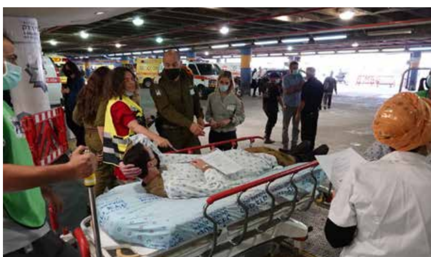
תרגיל עורף לאומי - מטה חירום בתרגיל מלחמה בצפון ראשון מסוגו בארץ