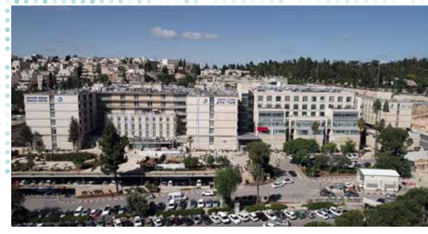
שערי צדק. מובילים בחוויית המטופל.

על פי מחצאי סקר שערך משרד הבריאות, גם השנה שערי צדק קיבל את הציון המסכם הגבוה ביותר בעיר ירושלים. הציון המסכם של חוויית מטופלים באשפוז בשערי צדק הוא מעל הממוצע ועומד על 86%. כמו כן, נרשמת עליה במדדי שביעות רצון של חוויית מטופלי המרכז הרפואי של 3% של שיפור מאז המדידה הראשונה בשנת 2014.