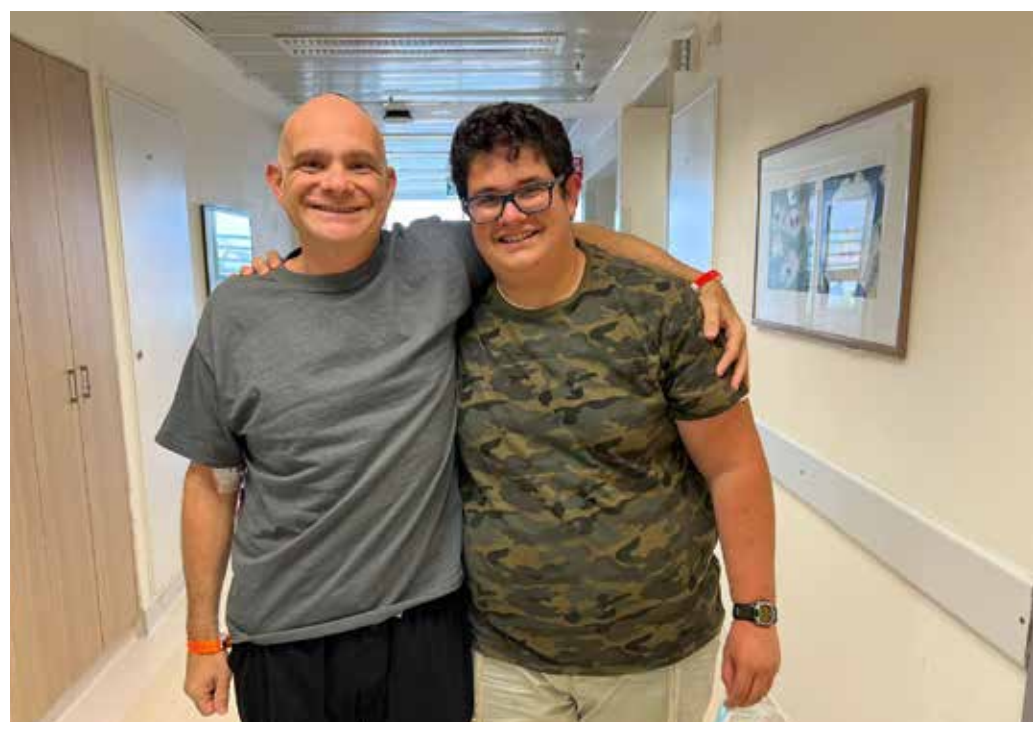
הבן תורם מח העצם ואביו המושתל הראשון של שערי צדק ביום השחרור מהמרכז הרפואי.