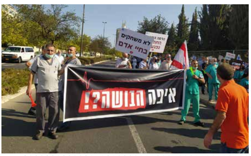
מחאת הענק של עובדי מערכות הבריאות בבתי החולים העצמאיים מול משרד האוצר.