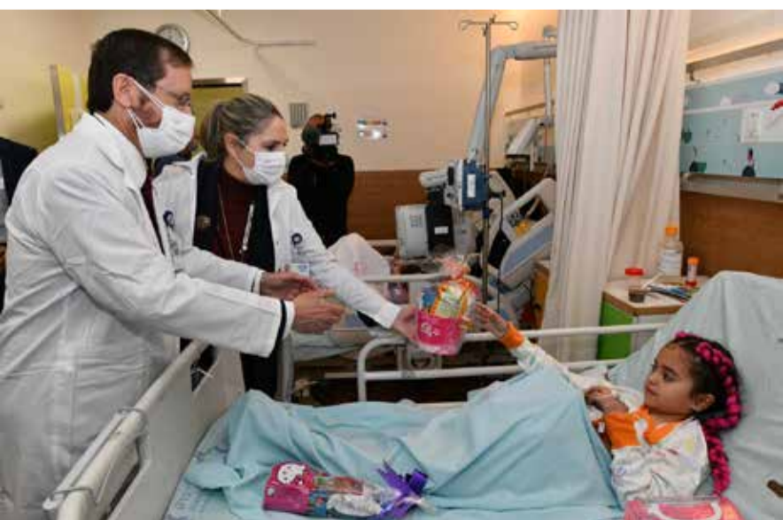
נשיא המדינה יצחק הרצוג ורעייתו מיכל משמחים מטופלת באחת ממחלקות הילדים בבית חולים וילף לילדים.