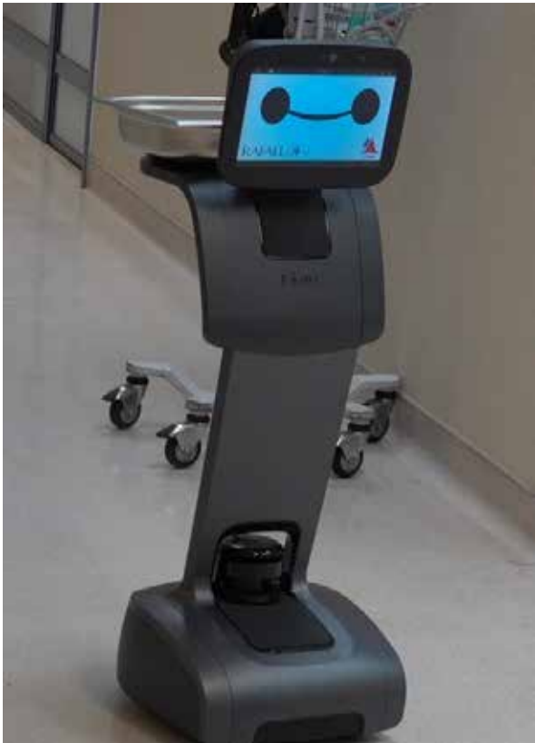
בתמונה: הרובוט החדש ב"סיבוב" היכרות בשערי צדק.