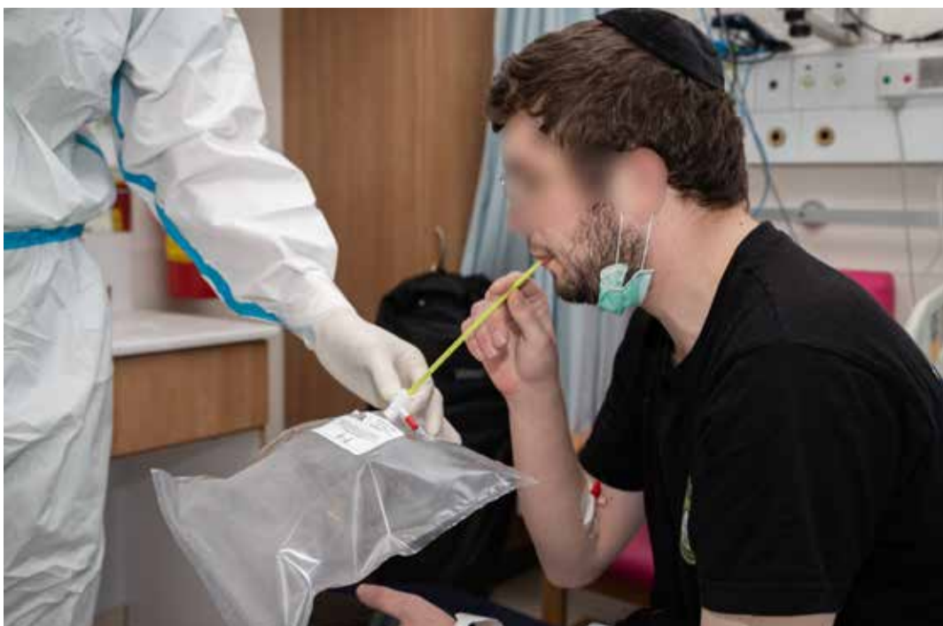
בתמונה: בדיקת קורונה במחלקת כתר בשערי צדק.