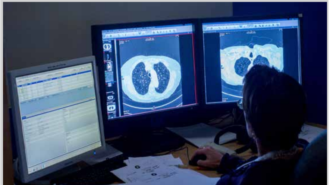
בתמונה: חדר בקרה של חדר הסיטי המקדמים של שערי צדק.

בתקופת היעדרותם העבודה במכון הייתה מאתגרת אף יותר, אך עם זאת צוות האגף כולו התגייס על מנת להבטיח פעילות סדירה ושוטפת גם במחלקות הקורונה שהוקמו וגם בשאר מחלקות בית החולים. הרנטגנאים כולם עברו לעבוד במשמרות ארוכות של 14 ועד 24 שעות.