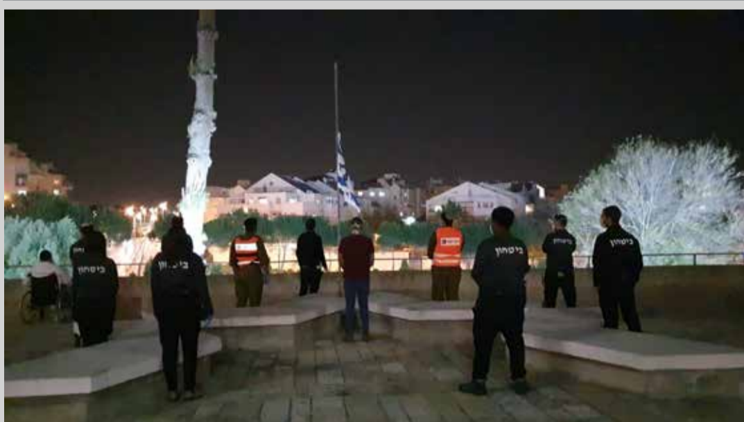
בתמונה: צוות הביטחון מוריד את הדגל לחצי התורן בערב יום השואה.