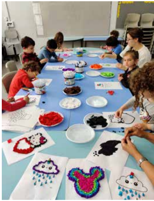
בתמונת ילדי עובדים בפעולות יצירה ובחוג חיות.

בין הפעילויות השונות קיימת שעת סיפור, חוגי חיות, חוגי אומנות שונים, הפעלות של ליצנים, אפיית מצות, חוגי בישול, פעילות ספורט, הפעלות של מוזיאון המדע, אילוף כלבים ועוד. חלק ניכר מהפעילויות הועברו בהתנדבות ע"י אנשים טובים שרצו לעזור. השתדלנו לבנות מידי יום לו"ז מסודר שניתן כל בוקר לצוות כדי ליצור תחושת סדר ולתת לילדים בטחון. הקושי העיקרי היה לצור לו"ז שמותאם לקבוצות קטנות ולגייס מפעילים מתחומים שונים שיסכימו להגיע למרות החשש להיות בקרבת ילדים. כמו כן הצורך לא לחשוף ילדים זה לזה אילץ אותנו להיות יצירתיים ולהביא פעילויות מגוונות כמעט ללא תקציב.