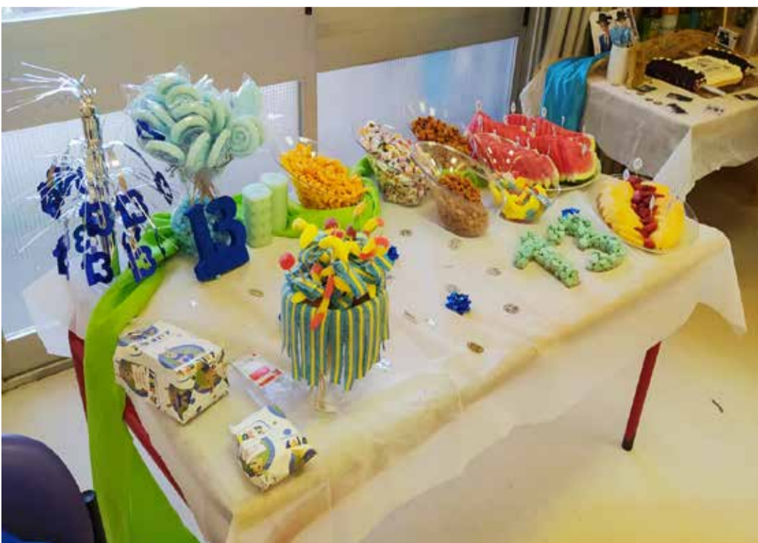
בתמונה: שולחן ערוך. בר מצווה חגיגית במיוחד במחלקה האונקולוגית.