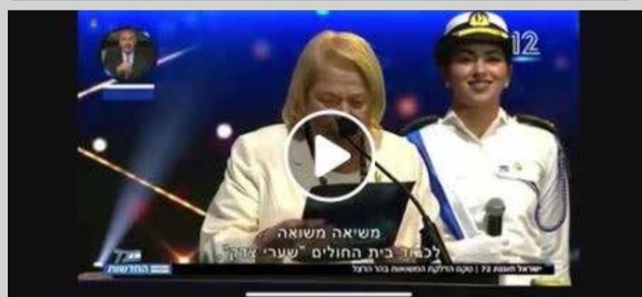
צפו ברגע המרגש בו מבשרת השרה רגב לריינה על הדלקת המשואה