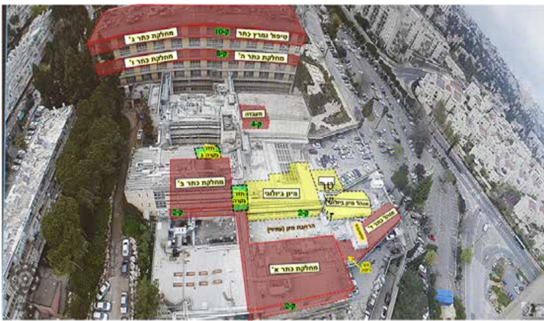
בתמונה: מערך הקורונה - המרכז הרפואי שערי צדק.