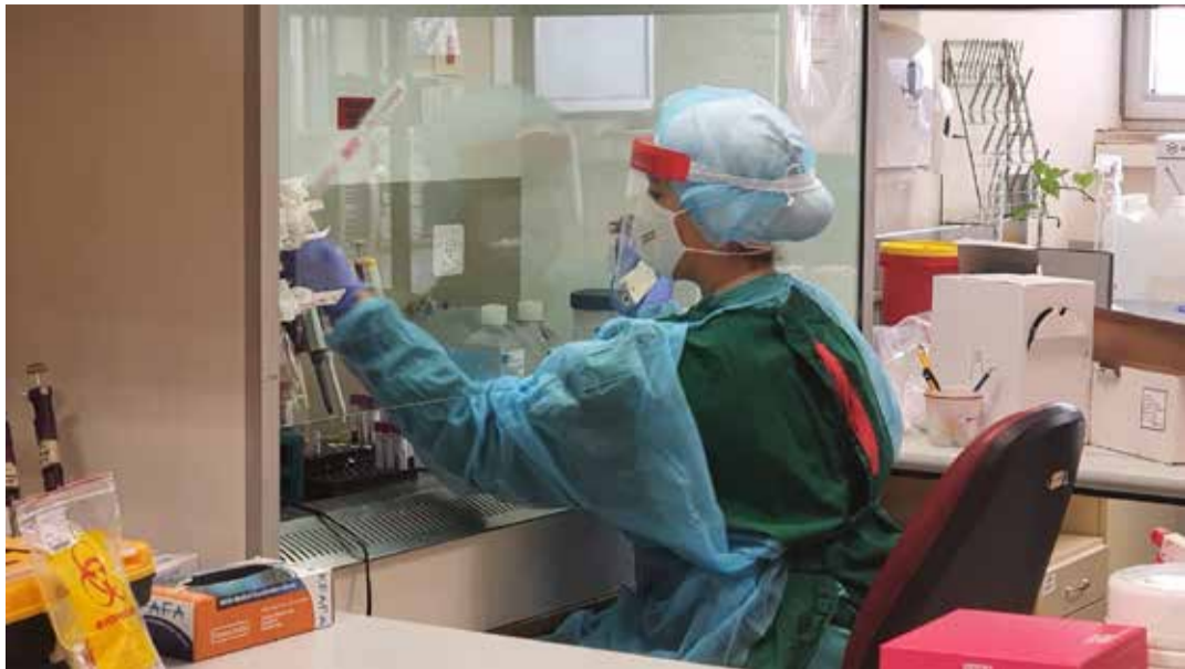
בתמונה: מעבדת מחקר ביובנק.

וטיפולים כנגד הקורונה ושערי צדק, כמטפל במאות חולי קורונה, נמצא בחוד החנית של המחקר הקליני והתרגום על הנגיף. מאגר המחקר האדיר שהוקם מהווה את הבסיס לכל מחקר שיעסוק בנגיף ויסייע באופן דרמטי לתהליכי הפיתוח והמחקר של חיסונים ותרופות לבלימת הקורונה. הפריזרים שלנו מכילים כבר אלפי דגימות שונות של מאות מטופלים ובכל יום נאספים מאות דגימות חדשות בשיטות מעבדה חדשניות."