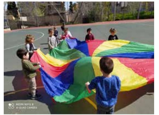
בתמונת הפנינג מסכם לקראת סגירת המעונות והחזרה לשגרה.

זו הייתה היערכות שלמה של כל המחלקה, הגבלנו את כל התנועה למשך זמן הביקור במהלכו הגיע הבן למחלקה דרך כניסת חירום בסיוע גורמי הביטחון אצלנו לצורך כך הופסקה הפעילות לצורך מעבר חלק של הבן בשטח הסטרילי שיועד לו. יממה לאחר הביקור האב נפטר."