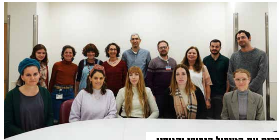
צוות השירות הפסיכולוגי

טיפול פסיכולוגי התומך בהתמודדות הרגשית והנפשית של החולים במהלך השלבים השונים של המחלה החל בשלב הגילוי, דרך שלבי הטיפול השונים, שלבי ההחלמה