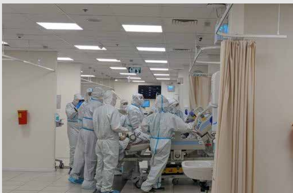
העברת המטופל הראשון למחלקת הכתר החדשה.

המחלקה החדשה והמאובזרת, בנויה בצמוד ובנגישות מלאה ומופרדת מיתר מחלקות ויחידות המרכז הרפואי. מכילה מתחמי ישיבה, מטבחון, שירותים מקלחות ופינת טלוויזיה ואזור ייעודי שמאפשר טיפול רפואי בחולי קורונה הסובלים מבעיות רפואיות אחרות שאינן קשורות בנגיף.