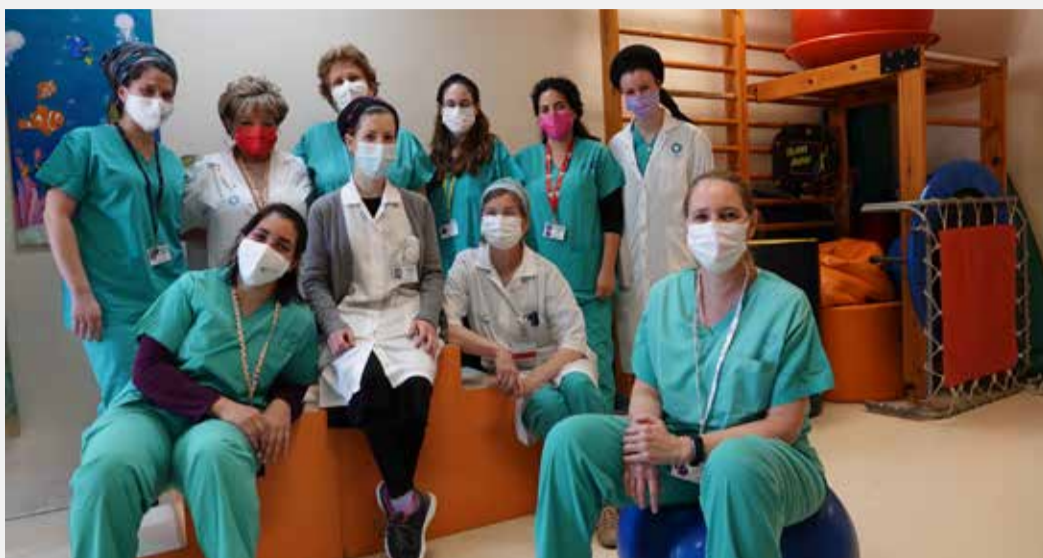
צוות המחלקה לריפוי בעיסוק בשערי צדק.

אנו שמחות וגאות להיות חלק ממשפחת המרכז הרפואי שערי צדק ומזמינות אתכם להתייעץ אתנו".