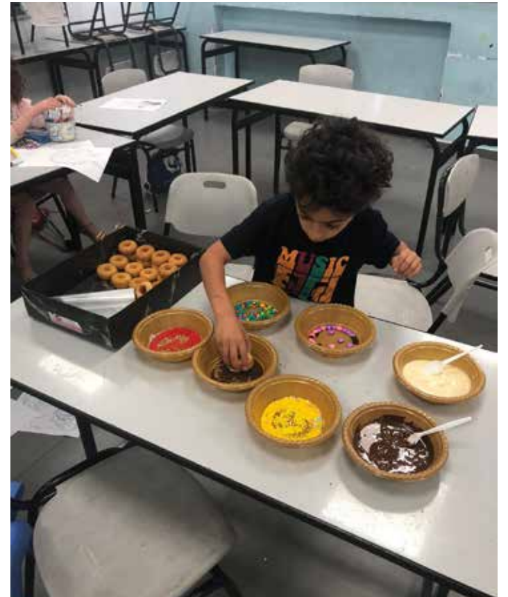
עושים חיים בקייטנה!