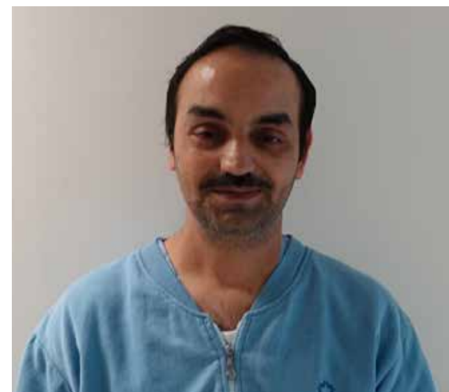
אני מאוד אוהב את שערי צדק ואני שמח לעבוד כאן. עשור של צמיחה.