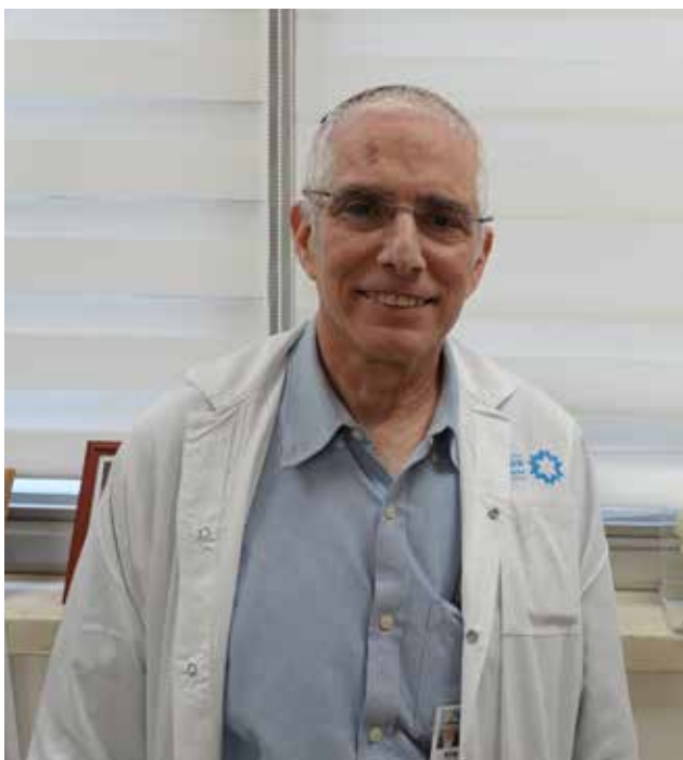
סירגיה בשערי צדק. מבט לאחר עשר שנים.