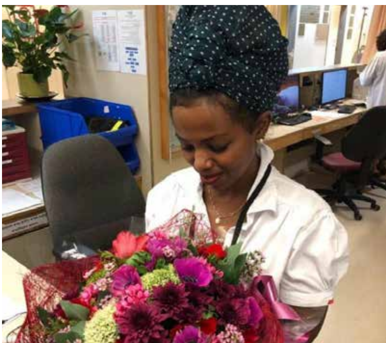
המטופל שמאחורי החלוק. עשור של אמפיטה.

אסיים בחלק שמסכם את העשור שלי, לפני מספר שבועות. פגשתי אדם שקרא לי באמצע הרחוב, "שמך אלמד! עניתי כן. "את עובדת במחלקה 8 פנימית?". עניתי כן. "רציתי להודות לך! לפני שבע שנים התקשרת אליי בשעה 2:10 בלילה, כדי להגיד לי שאגיע מהר לבית החולים, שאבא מידרדר ושחשוב שאגיע. בזכותך הגעתי והספקתי להיפרד מאבא שלי". באותו רגע מאוד התרגשתי. הוא היה נרגש מאוד, הודה לי והמשיך בדרכו.