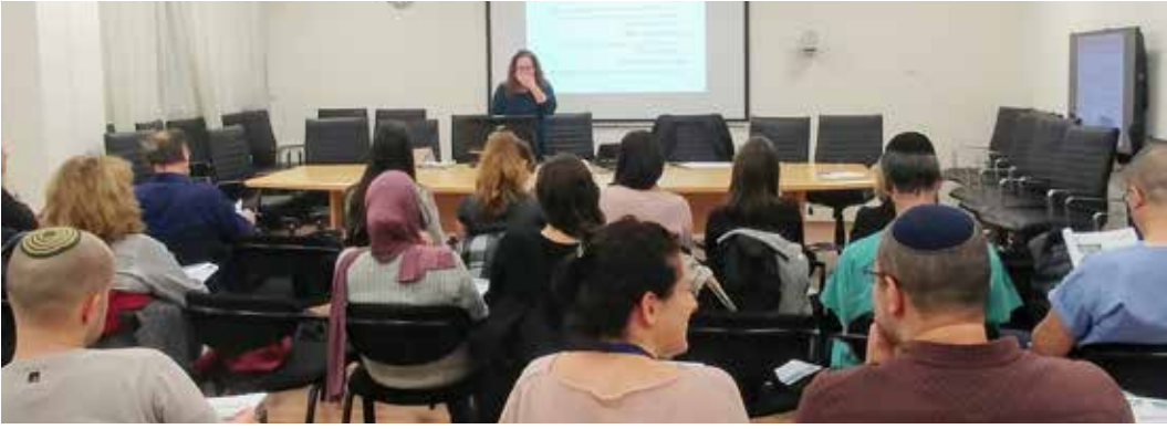
בתמונה: קורס אתיקה שנערך בחודש האחרון.

קורס אתיקה קלינית (GCP) הנדרש מכל מי שמבצע מחקרים במרכז הרפואי ומקנה תעודה בין לאומית המאפשרת שותפות במחקרים קליניים בכל העולם, זאת במסגרת עידוד הצוות לקדם את המחקר הבסיסי והקליני במרכז הרפואי.