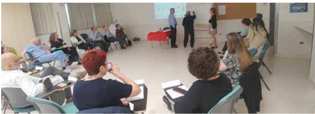
בתמונה: סדנת מיומנויות גישור למנהלים בשערי צדק.

סדנת מיומנויות גישור למנהלים מכלל המגזרים בבית החולים התקיימה בשיתוף עם מכון גבס והעשירה את הסגל הניהולי בכלים נוספים להתמודדות עם קונפליקטים בתוך הצוות, בין מחלקות ועם מטופלים ובני משפחה.