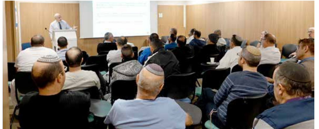
בתמונה: ההרצאה הראשונה בסדרה.